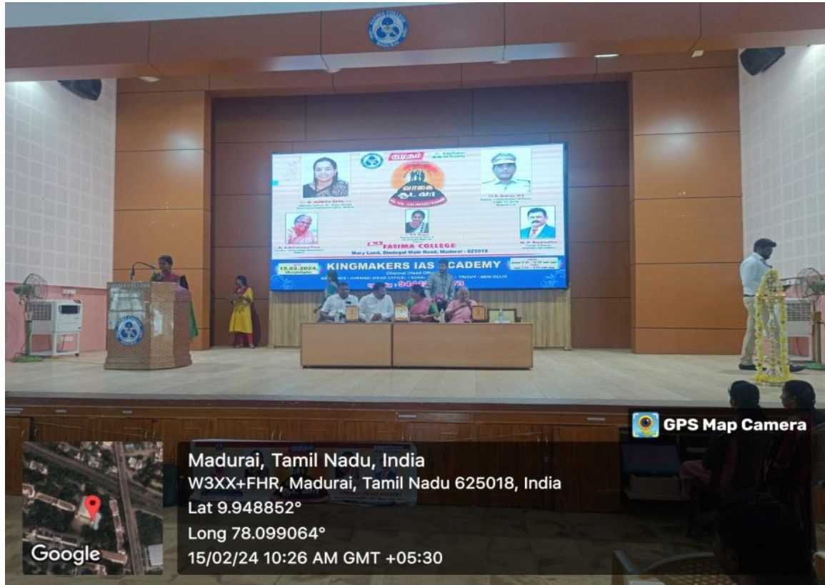
Guests being welcomed by welcome Address

Affiliated to Madurai Kamaraj University Re-Accredited with 'A++' by NAAC (Cycle - IV) Mary Land, Madurai - 625018, Tamil Nadu