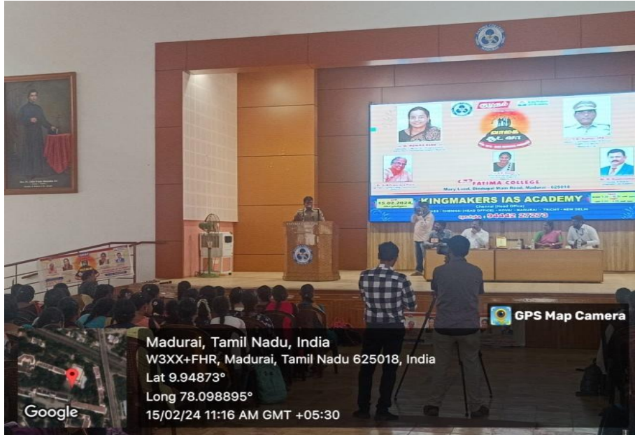
Active listening of the Students

Affiliated to Madurai Kamaraj University Re-Accredited with 'A++' by NAAC (Cycle - IV) Mary Land, Madurai - 625018, Tamil Nadu